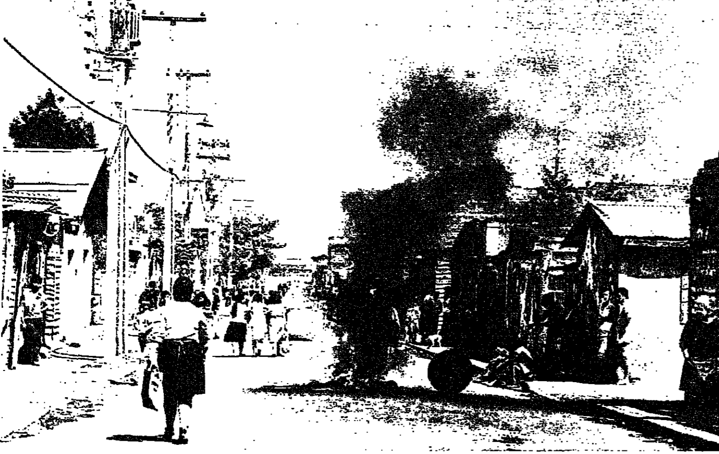
فقراء صواحي سنتياغو : الازمة على الوجوه والارصفة